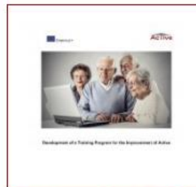
Training material (PDF)