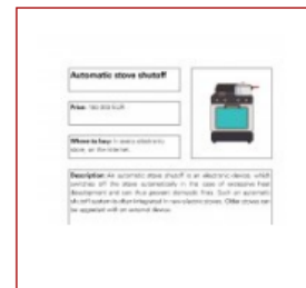
Automatic stove shutoff (PDF)

Jede PDF-Datei zu unterstützenden Technologien bietet eine Beschreibung sowie Links zu Erklär-Videos und/oder weiteren Informationen wie Studien oder Wikipedia-Einträgen. Ein Klick auf den Link öffnet eine neue Internetseite.