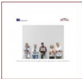
Experimental training materials (PDF)