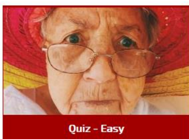
Quiz - Easy