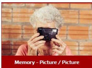
Memory - Picture / Picture