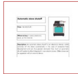
Automatic stove shutoff (PDF)

Cada archivo sobre tecnologías asistidas contiene una descripción y enlaces a videos explicativos de YouTube así como más información de Wikipedia o páginas similares. Si aprieta a una de estos botones, una nueva pestaña se abrirá.