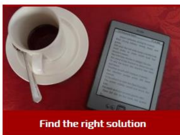
Find the right solution