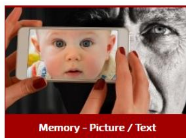
Memory - Picture / Text