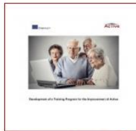
Training material (PDF)