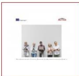
Experimental training materials (PDF)