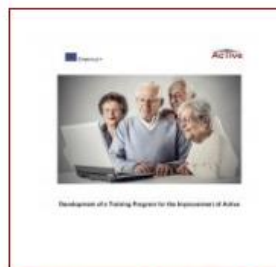
Training material (PDF)