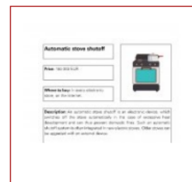
Automatic stove shutoff (PDF)

Fiecare fisier care se bazeaza pe tehnologia de asistenta ofera o descriere a acesteia precum si o legatura catre o cautare pe YouTube, cu videoclipuri explicative si/sau informatii suplimentare precum studii sau pagini Wikipedia privind fiecare tehnologie de interes. Facand clic pe acestea, se va deschide o noua fila.